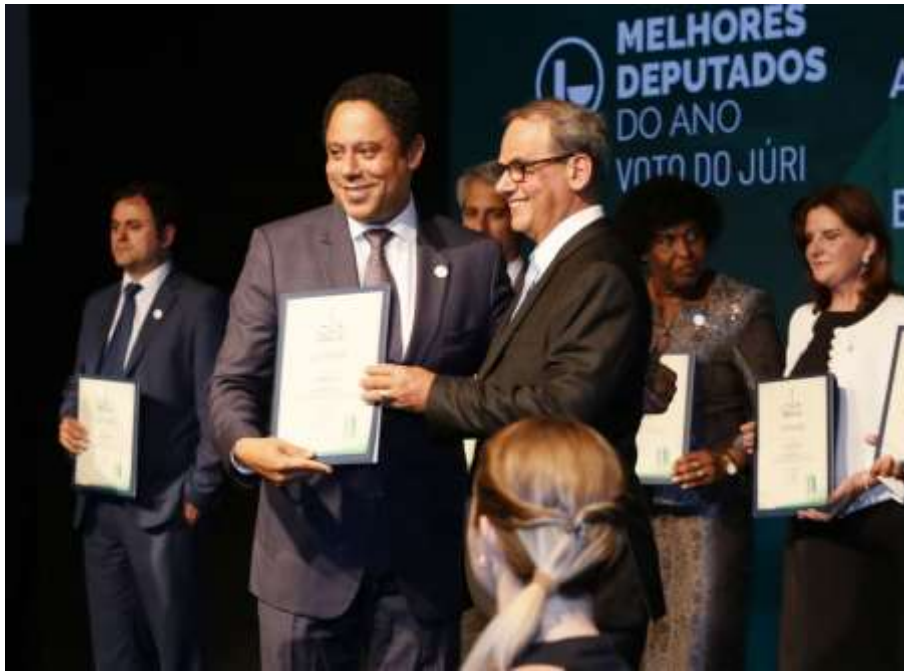
Deputado Orlando Silva (PCdoB/SP) recebe Prêmio Congresso em Foco

No dia 13 de agosto, foram anunciados os vencedores do Prêmio Congresso em Foco 2018. O coordenador do tema Saúde e Segurança do Trabalho da Frente Parlamentar da Química, deputado Orlando Silva, líder do PCdoB na Câmara dos Deputados, foi escolhido entre os 10 melhores deputados por votação do júri, que leva em conta critérios como a assiduidade em sessões deliberativas, a participação nos debates do Parlamento, o desempenho na apresentação de propostas legislativas, a capacidade de articulação política e os compromissos no combate à corrupção e ao desperdício de recursos públicos e na defesa da democracia e do desenvolvimento sustentável.