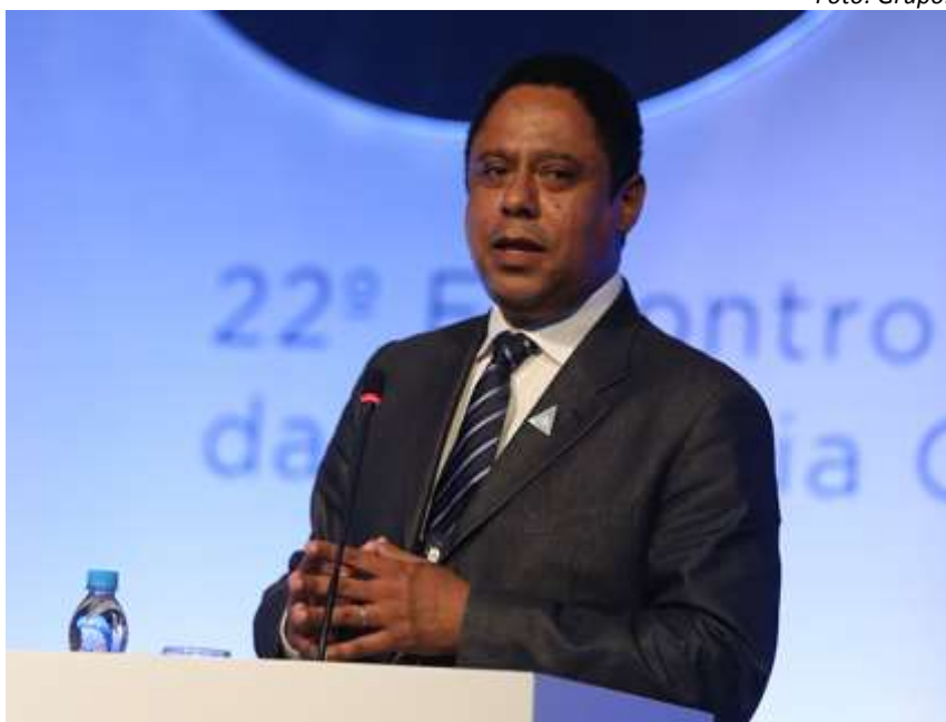
Deputado Orlando Silva (PCdoB/SP), no Encontro Anual da Indústria Química em 2017

Os parlamentares, que são os líderes de seus partidos na câmara, destacarão em sua apresentação a importância da atividade industrial responsável com o meio ambiente, seus colaboradores e com as comunidades do entorno.