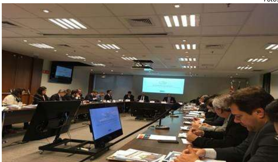
CNI promove lançamento da Coalizção Empresarial para Facilitação de Comércio e Barreiras (CFB)