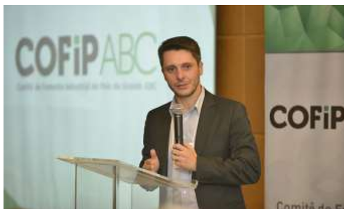
Deputado Alex Manente (PPS/SP), no IV seminário Dia da Indústria