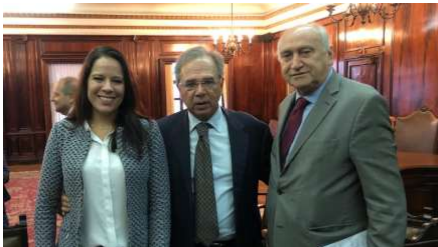
A diretora de Relações Institucionais, Comunicação e Sustentabilidade da Abiquim, Marina Matta, o ministro da Economia, Paulo Guedes; e o presidente-executivo da Abiquim, Fernando Figueiredo

O ministro da Economia, Paulo Guedes, recebeu associações setoriais para debater a situação atual e as perspectivas da indústria de transformação, no dia 19 de julho, no escritório do Ministério da Economia, no Rio de Janeiro.