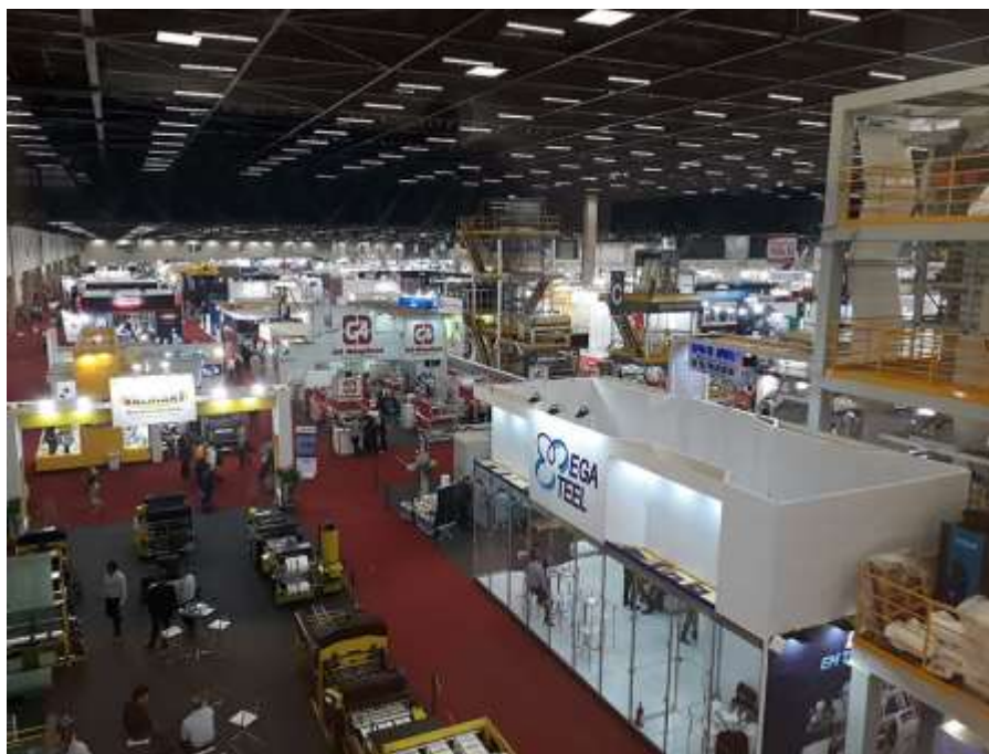
Plástico Brasil 2017

A Plástico Brasil 2019 – Feira Internacional do Plástico e da Borracha, que acontece de 25 a 29 de março, no São Paulo Expo, receberá 69 empresas expositoras internacionais de 13 países como Alemanha, Argentina, Áustria, China, Estados Unidos, Hungria, Índia, Itália, México, Portugal, Suíça, Taiwan e Turquia, o que representa um crescimento de 122% no número de expositores internacionais em relação à edição inaugural da mostra.