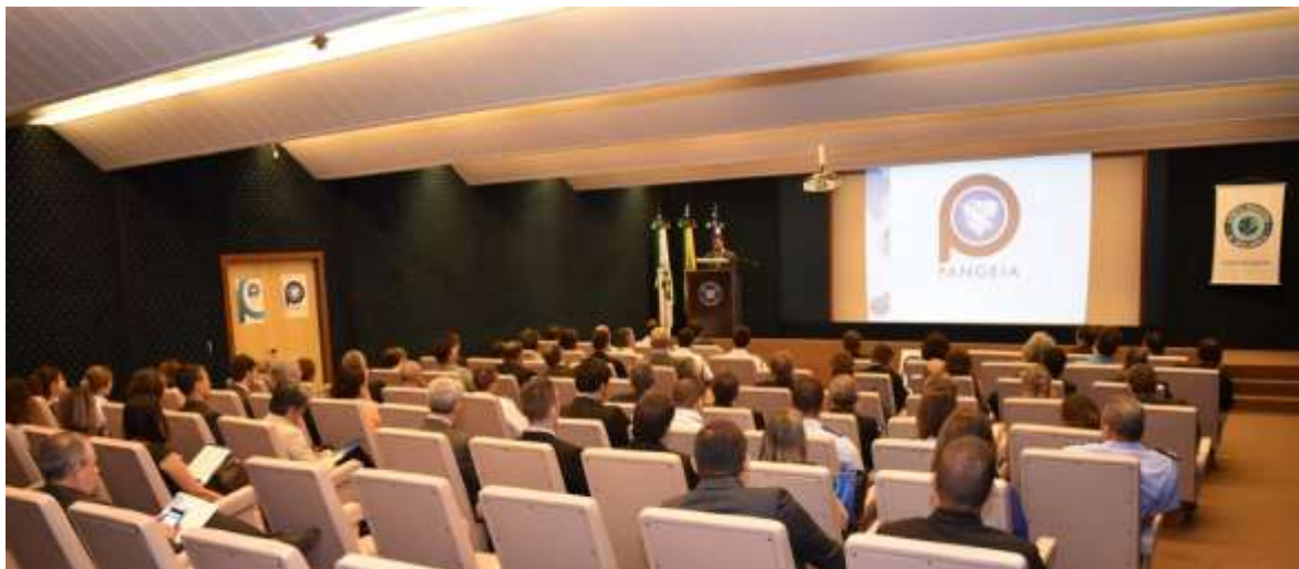
Cerimônia de lançamento do Pangeia na sede da Abin

A Associação Brasileira de Inteligência Gabinete de Segurança Social (ABIN) realizou, no dia 6 de fevereiro, em Brasília, a cerimônia de lançamento do Programa de Articulação Nacional entre Empresas, Governo e Instituições Acadêmicas para a Prevenção e Mitigação do Risco de Eventos Químicos, Biológicos, Radiológicos e Nucleares Selecionados (Pangeia).