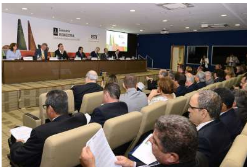
Cerimônia de abertura do Seminário RedIndústria 2019

A Abiquim participou, nos dias 5 e 6 de fevereiro, do Seminário RedIndústria 2019, organizado pela