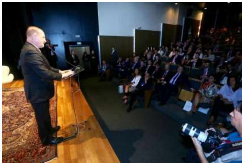
O ministro-chefe da Casa Civil, Onyx Lorenzoni

O ministro-chefe da Casa Civil, Onyx Lorenzoni, foi responsável por encerrar o evento. O ministro se colocou firmemente a favor da redução do Estado: “Não temos medo de dizer que o governo hoje tem 119 mil funções e vai acabar com 20 mil”. Segundo o ministro, a nova gestão está quebrando uma série de paradigmas. “Adotamos um modelo de governança pública com metas concretas para os primeiros cem dias, com revisões de alcance”, expôs. Ao comentar sobre o pacote proposto pelo ministro da Justiça, sublinhou o pioneirismo: “O Brasil será o primeiro País com alto controle anticorrupção, com um departamento dentro dos ministérios que cuida dessa relação. É preciso mudar a cultura”.