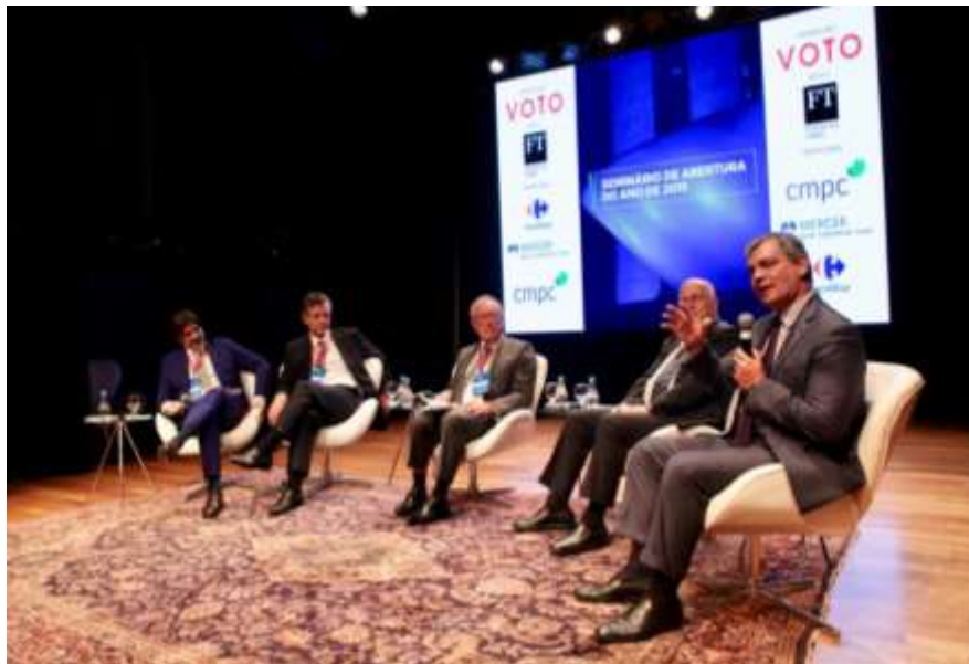
O secretário especial de Comércio Exterior e Assuntos Internacionais do Ministério da Economia, Marcos Troyjo (a direita), no painel “Como modernizar o Estado Brasileiro e Abrir a Economia Brasileira”

O secretário especial de Comércio Exterior e Assuntos Internacionais do Ministério da Economia, Marcos Troyjo, participou do painel “Como modernizar o Estado Brasileiro e Abrir a Economia Brasileira”. Troyjo explicou que há três elementos no projeto internacional do Planalto: abertura, conjuntura e estrutura. Citando tratativas avançadas com Estados Unidos, União Europeia e Mercosul, provocou: “O grande acordo comercial do Brasil é com ele mesmo. O Estado tem de sair da frente. O Brasil precisa parar de atrapalhar o Brasil”, disse.