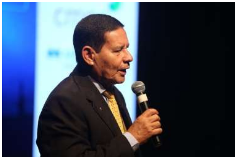
O vice-presidente da República general Hamilton Mourão participou da abertura do evento

O Seminário de Abertura do Ano 2019, promovido pelo Grupo Voto em parceria com o jornal Financial Times reuniu, no dia 13 de fevereiro, líderes políticos e empresariais para debater propostas sobre a agenda de ações e reformas necessárias no País.