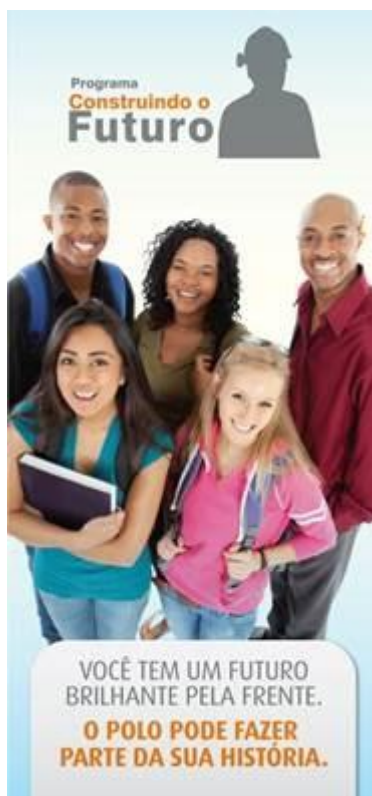
Folder do Programa

Programa “Construindo o Futuro” apresenta opções de carreiras aos estudantes do entorno do Polo Industrial de Camaçari, na Bahia