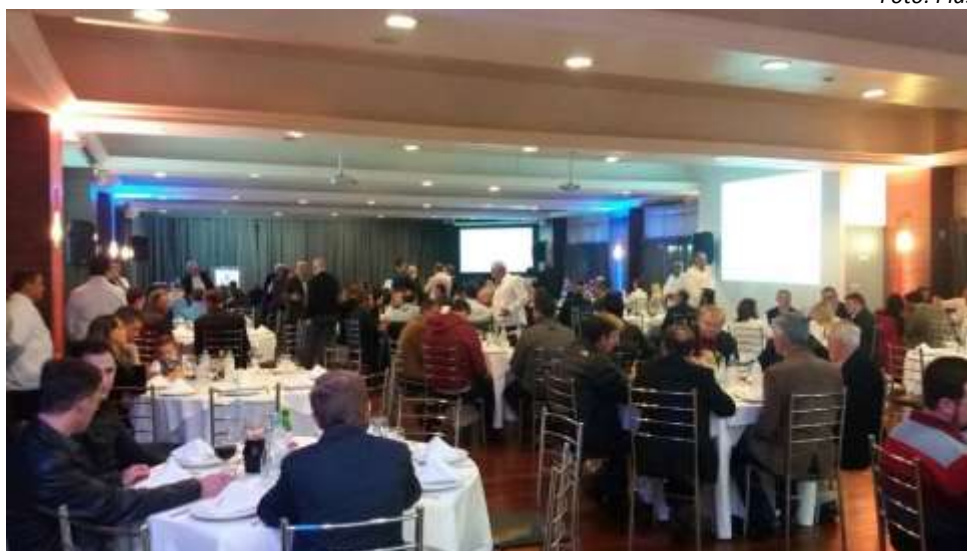
Reunião-Jantar do Simplás

No dia 26 de março foi realizado o lançamento regional da segunda edição da Plástico Brasil – Feira Internacional do Plástico e da Borracha, durante a Reunião-Jantar do Sindicato das Indústrias de Material Plástico do Nordeste Gaúcho (Simplás), realizado em Caxias do Sul (RS). O evento contou com uma palestra do presidente do Simplás,