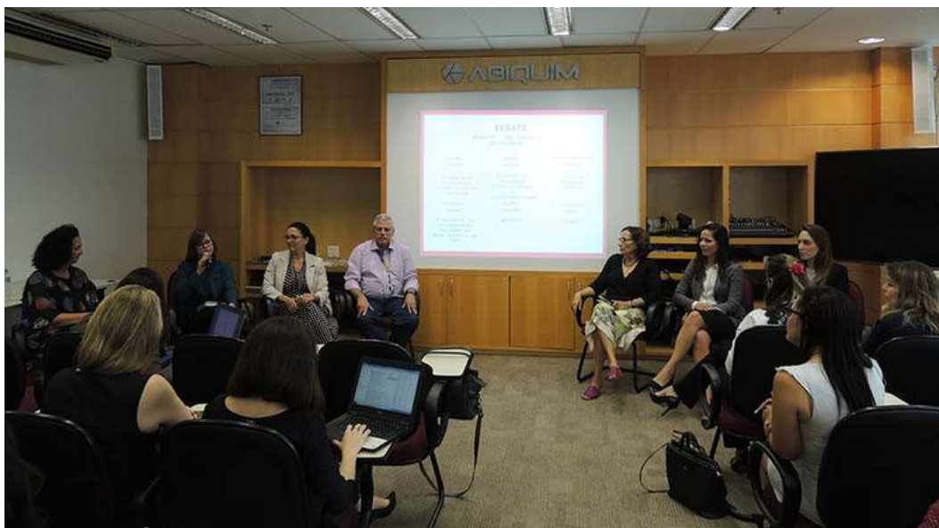
Palestrantes do evento A Diversidade na Indústria Química Brasileira: Liderança Feminina

A Abiquim realizou no dia 29 de março o evento “A Diversidade na Indústria Química Brasileira: Liderança Feminina”, para promover o debate sobre a participação das mulheres na indústria química.