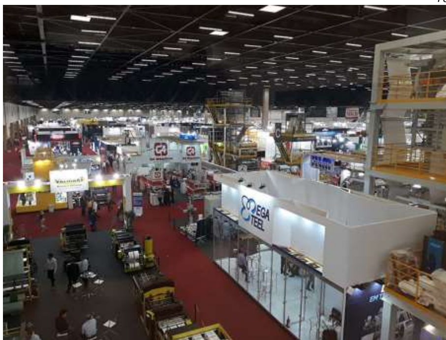
Vista geral da primeira edição da Plástico Brasil, realizada em 2017