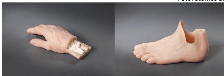
Próteses ortopédicas da empresa Stamos Braun Prothesenwerk