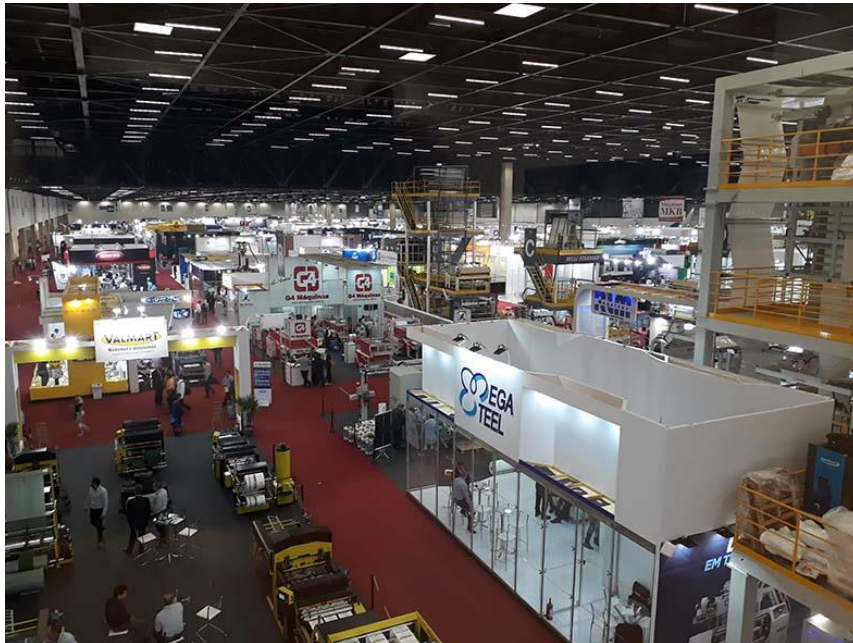
Vista geral da Plástico Brasil 2017

A Plástico Brasil - Feira Internacional do Plástico e da Borracha fecha o primeiro semestre de 2018 com mais de 60% das áreas comercializadas para a segunda edição do evento, que acontecerá entre os dias 25 e 29 de março de 2019 no São Paulo Expo, na capital paulista.