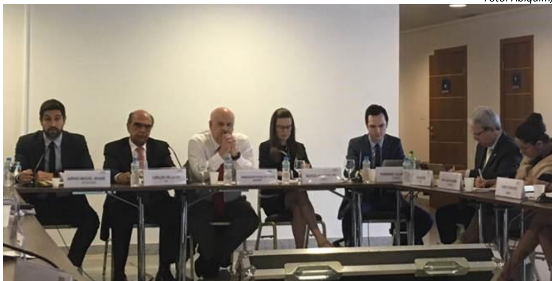
Abrão Árabe Neto, Secretário de Comércio Exterior do MDIC (à esquerda), ladeado pelo Diretor de Desenvolvimento Industrial da CNI, Carlos Eduardo Abjoudi, e por outras autoridades durante café da manhã de entrega do documento assinado por 28 entidades setoriais

Em 5 de julho, a Confederação Nacional da Indústria (CNI) promoveu café da manhã em sua sede, em Brasília, que contou com a participação de diversas autoridades relacionadas à defesa comercial no Brasil e de representantes empresariais de vários setores para oficializar a entrega do documento assinado pela Abiquim e por mais 27 entidades industriais contendo propostas para o aprimoramento das avaliações de interesse público em defesa comercial.