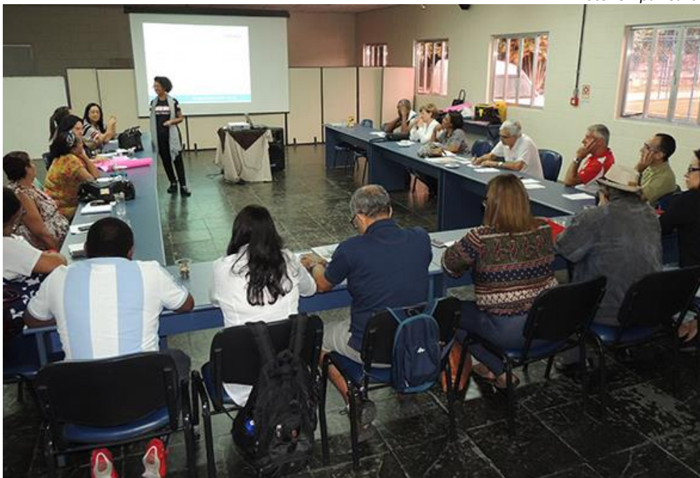
Conselheiros do CCC Unipar Carbocloro e membros do Núcleo Comunitário de Defesa Civil participam de curso ministrado pelo Sesi-SP

Em junho foi realizada capacitação dos membros do Conselho Comunitário Consultivo da Unipar Carbocloro, ministrado pelo Serviço Social da Indústria (Sesi-SP), em Cubatão.