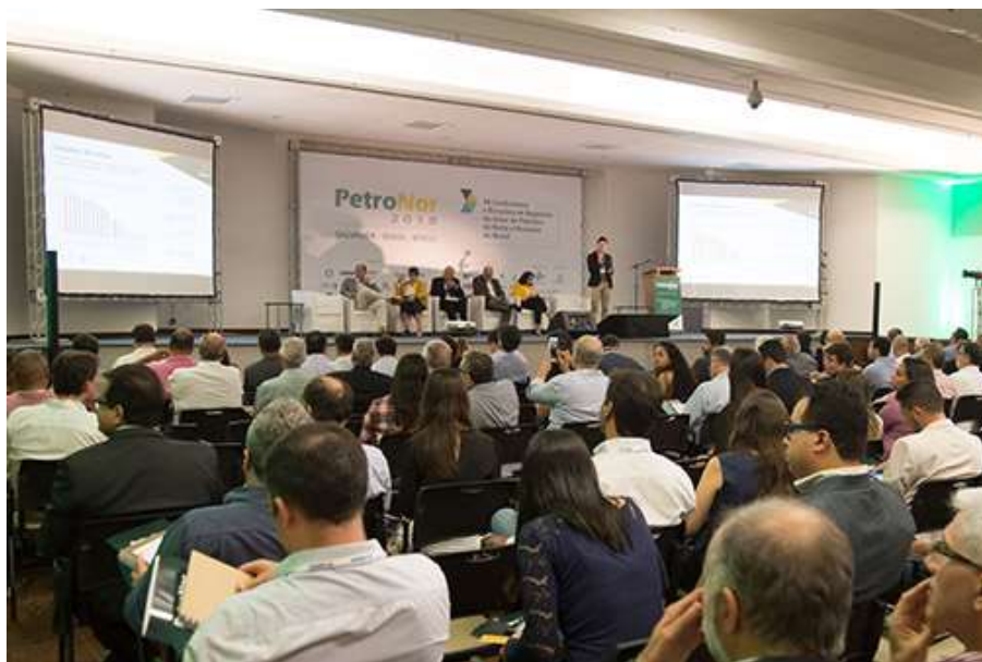
Conferência – “Fórum de Gás Natural” da PetroNor 2018

A VII Conferência e Encontro de Negócios do Setor de Petróleo do Norte e Nordeste do Brasil – PetroNor 2018, foi realizada nos dias 18, 19 e 20 de julho de 2018, no auditório do Senai-Cimatec, na capital baiana. O evento teve conferências e apresentações de temas ligados à retomada dos projetos onshore e offshore nas regiões norte e nordeste.