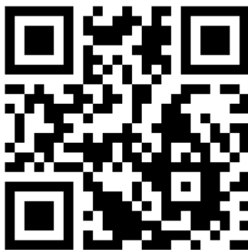
QR Code para download do aplicativo para sistema operacional Android

Clique aqui para fazer o download do aplicativo Congresso AR 2018 para iOS.